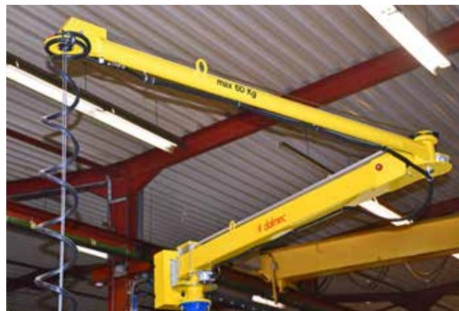
De laatste toevoeging in Beernem was een vaste opstelling, met een zeer groot bereik, zodat twee machines de nodige ondersteuning kunnen krijgen.

Meta-Tec (Beernem) en Finemechanics Europe (Laarne) vormen sinds 2007 een sterke tandem. Beiden delen dan ook eenzelfde ontstaansgeschiedenis als toeleverancier in CNC-draai- en freeswerk met oog voor kwaliteit en nauwkeurigheid. Dankzij het complementaire machinepark kunnen klanten er terecht voor een breed bereik in alle materialen. Het draaiwerk varieert van 3 mm tot 900 mm, freeswerk kan tot 1.000 x 2.000 mm en de vijfassige bewerkingen tot 700 x 500 x 400 mm. CEO Filip Lannoye: "De synergie tussen Meta-Tec en Finemechanics Europe schuilt in de complementariteit van de activiteiten, namelijk draai- en freeswerk. Het machinepark in Laarne is toegespitst op prototypes, enkelstuks en middelgrote series, terwijl we hier in Beernem ook probleemloos grote series aankunnen. Op die manier kunnen we eigenlijk meegroeien met onze klanten en hun producten. Dat heeft ons ook internationaal op de kaart gezet."