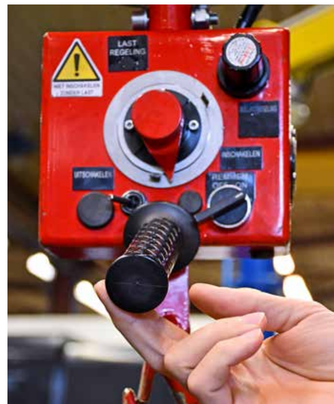
De bediening kan heel eenvoudig gebeuren, terwijl de operator te allen tijde een hand vrijhoudt.

Jaren geleden al investeerde de firma daarom in de technologie van Dalmecc om de handling van zware stukken over te nemen. De productieleiding was meteen gewonnen voor het concept dat een hoge ergonomie combineert met een eenvoudige en snelle bediening. "De eerste installatie die hier kwam in 2008, namelijk een mobiele versie met een heflast van 80 kg, kon van werkpost naar werkpost worden verplaatst. Dit gebeurde in functie van waar zich op dat moment letterlijk het zwaartepunt van onze productie bevond. Onze operatoren keken er de eerste maanden wat argwanend naar, stoere bonken hadden geen ondersteuning nodig. Maar eenmaal ze het toestel uitgetest hadden, wilde iedereen er mee aan de slag", herinnert