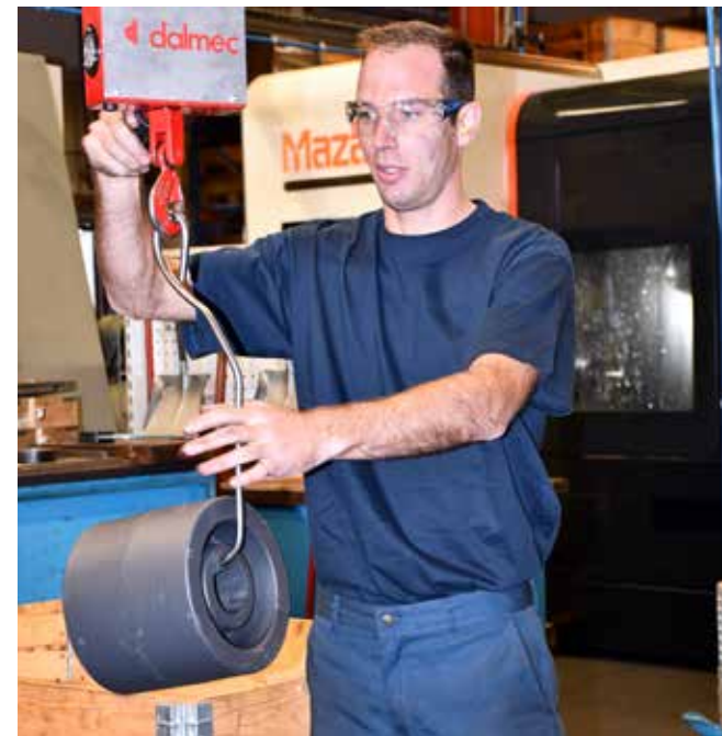
De operatoren tonen zich bijzonder tevreden over de systemen van Dalmecc op de werkvloer.

'Het zegt alles dat we ze hier heel weinig over de vloer zien komen, tenzij om de aankoop van een nieuwe machine te bespreken'